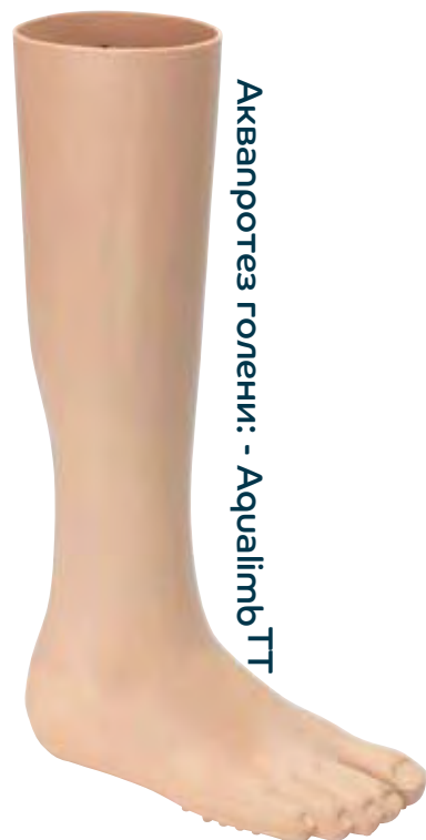
Аквапротез голени: - Аqualimb TT