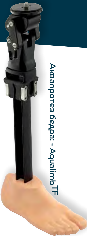
Аквапротез бедра: - Аqualimb TF